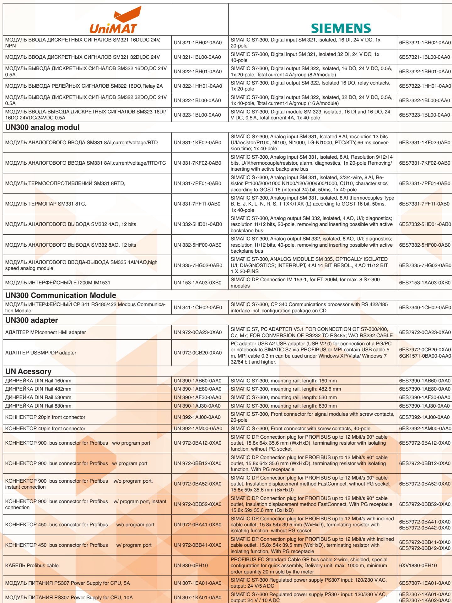
Таблица замены оборудования Siemens на оборудование UniMAT

Весь спектр продукции UniMAT в наличии на складе в Москве и регионах!